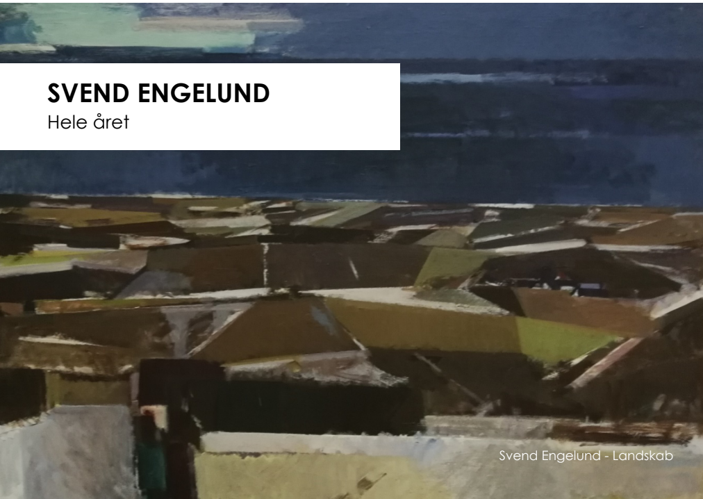
Svend Engelund - Landskab