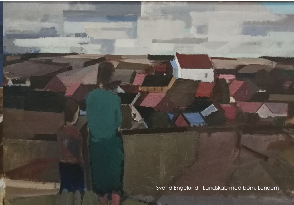
Svend Engelund - Landskab med børn, Lendum